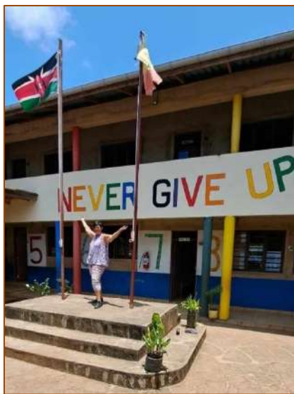
Onze nieuwe slogan